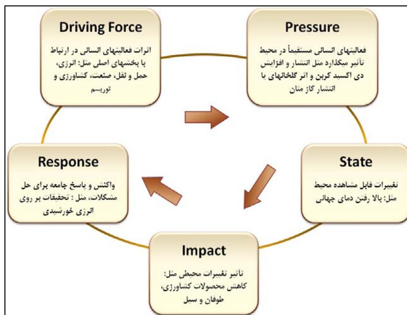
شکل ۱- شمای مدل چرخشی عوامل و اثرات مستقیم، ثانویه و نهایی چارچوب DPSIR

همان طور که بیان شد یکی از عوامل بیابان‌زدایی، فعالیت‌های نادرست انسانی، مانند کشاورزی مفرط، چرای بیش از حد، جنگل‌تراشی و تغییر جمعیت محلی همراه با ایجاد محیطی ناسازگار روستاها است. فعالیت‌های مختلف انسانی (Driving force) به عنوان نیروهای پیش‌برنده در محیط باعث اعمال فشار روی محیط فیزیکی (Pressure) و به دنبال آن تغییرات کیفی در وضعیت موجود محیط (State) می‌شود.