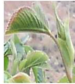
شکل شماره ۷ شکل شماره ۸ شکل شماره ۹