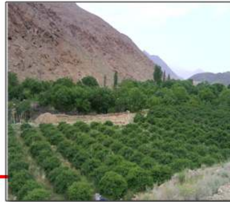
Fig.1: the study site plan

There are 450 Gole Mohammadi shrubs in 27 agricultural plots in the farm under investigation. The annual average temperature of the area is 12.5°C; the average temperature of the hottest month (July) (min. 20.1°C – max. 29.7°C) with 24.9 °C average and in the coldest month (January) (min. -3.7°C – max. 3.5°C) with a -0.1°C. The annual precipitation average of the