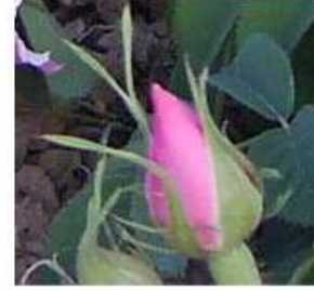
شکل شماره ۱۰ شکل شماره ۱۱ شکل شماره ۱۲

پایان می‌رسد (۹۷). میانگین روزانه، حداقل و حداکثر دما تا شروع دوره مذکور به ترتیب ۲۰، ۱۲، ۲۷ درجه سلسیوس مشاهده گردید.