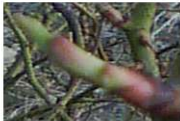
شکل شماره (۴) مرحله سبز شدن جوانه ها

شکفتن و سبز شدن جوانه (۰۷): آغاز مرحله سبز شدن جوانه ها در باغ آزمایشی در منطقه ی برزک در ۱۱ فروردین ماه بود. و پایان مرحله در تاریخ ۱۴ فروردین ماه بوده است. میانگین روزانه حداقل و حداکثر دما در این مرحله به ترتیب برابر ۹، ۱/۷، ۱۶/۲ درجه سلسیوس بدست آمد. (شکل شماره ۴).