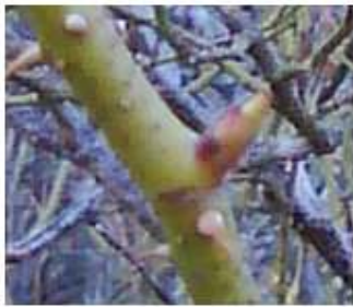
شکل شماره (۳) مرحله متورم شدن جوانه ها

مرحله اصلی جوانه زنی (۰): این مرحله عبارت است از تورم جوانه ها، مرحله مذکور به دو مرحله فرعی زیر تقسیم می شود. متورم شدن جوانه ها (۰۱): در این مرحله جوانه ها شروع به متورم شدن می کنند و فلس های پوشاننده را کنار می زنند. شروع متورم شدن در تاریخ ۲۷ اسفند و اتمام آن در تاریخ ۱۰ فروردین ماه روی داد. این مرحله با رسیدن دما به ۶.۵ درجه سلسیوس شروع گردید، میانگین روزانه، حداقل و حداکثر دما در این مرحله به ترتیب برابر ۷/۵، ۲/۲، ۱۲/۹ درجه سلسیوس بود (شکل شماره ۳).