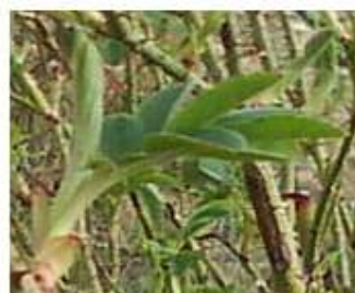
شکل شماره (۵ و ۶) مراحل نمو برگ

مرحله نمو برگ (۱): قابلیت رویت برگ‌ها (۱۰): این مرحله با آشکار شدن نخستین جفت برگ حقیقی (طول برگ به اندازه ۱۰ میلی متر) آغاز می‌شود فاز مذکور در تاریخ ۱۵ فروردین ماه در دیده بانی‌ها مشخص گردید. یک برگی شدن (۱۱): نخستین جفت برگ باز شده است. اندازه برگ هنوز کامل نشده است. برگ‌ها به رنگ سبز روشن هستند. این فاز در