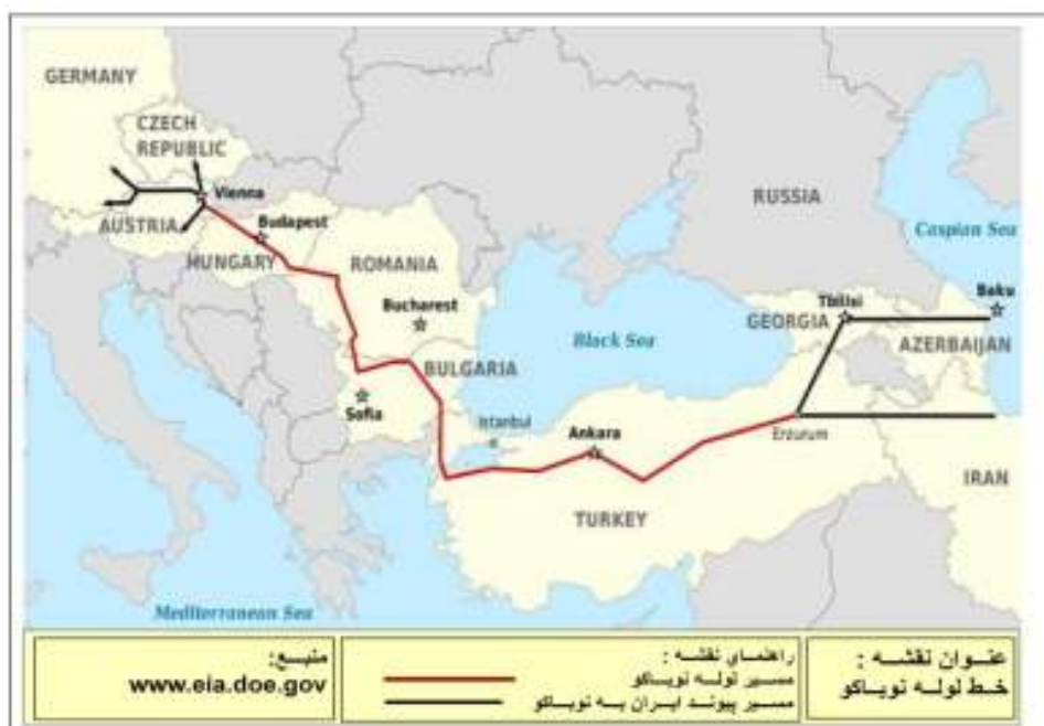
نقشه شماره ۱: مسیر خط لوله نوباکو

جنوبی، هند و پاکستان از واردکنندگان عمده گاز در آسیا می‌باشند که ایران قراردادهایی را با آنها به امضاء رسانیده است. مهمترین طرح انتقال گاز در این منطقه خط لوله صلح می‌باشد که قرار است گاز ایران را به پاکستان و هندوستان صادر انتقال دهد. اما تا حالا این پروژه به دلیل اختلافات سیاسی بین هند و پاکستان عملی نگشته است. در خرداد ۱۳۸۹ ایران و پاکستان به توافق نهایی در زمینه صادرات گاز ایران به پاکستان رسیدند و قرار شده است که از سال ۲۰۱۴ روزانه ۲۱/۵ میلیون متر مکعب گاز به پاکستان برای مدت ۲۵ سال صادر شود.