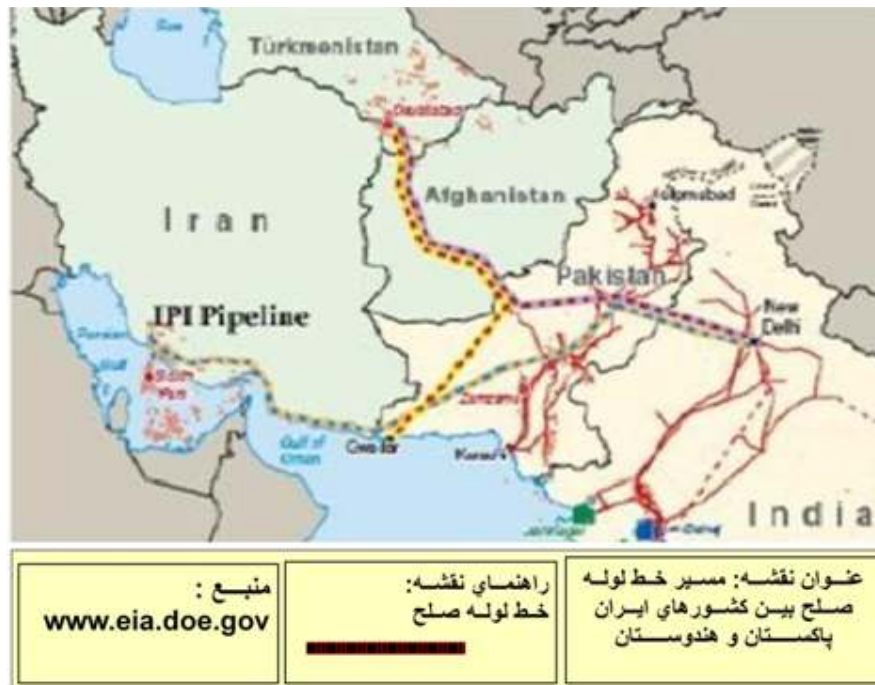
نقشه شماره ۲: مسیر خط لوله صلح

جهان مبدل می‌کند چرا که هژمونی انرژی توان و قدرت ایران را افزایش می‌دهد.