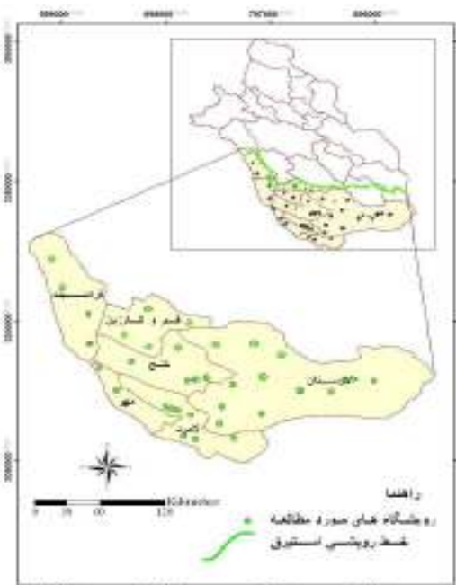
شکل ۱: نقشه خط رویشی استبرق و پراکنش رویشگاه‌های مورد مطالعه

نقشه پراکنش و خط رویشی استبرق مشخص و تهیه گردید. از آنجا که مطالعه شرایط رویشگاهی گیاهی چون استبرق، با فراوانی کم و پراکنده مد نظر بود از روش نمونه‌برداری انتخابی جهت انتخاب رویشگاه استفاده شد (زبیری، ۱۳۸۶). در مجموع ۳۵ رویشگاه مورد مطالعه قرار گرفت. نمونه‌برداری مشخصات گیاهی در داخل هر رویشگاه شامل درصد پوشش تاجی و تراکم بترتیب از ترانسکت خطی و شمارش تعداد کل در واحد سطح انجام گرفت. موقعیت جغرافیایی رویشگاه‌ها و نقاط نمونه‌برداری توسط GPS ثبت و با استفاده از نرم‌افزار ArcGIS نسخه ۹/۲ بر روی نقشه منتقل گردید (شکل ۱).