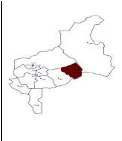
شکل ۱- موقعیت منطقه مطالعاتی در استان یزد

ناهمواری‌های منطقه را می‌توان به دو دسته مناطق کوهستانی با شیب بیشتر از ۱۵ درصد و مناطق دشتی با شیب کمتر از ۱۵ درصد تقسیم کرد.