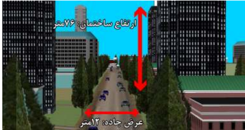
شکل ۳ - مدل سه بعدی بخشی از مسیر پیشنهادی شماره یک

شکل ۴ نیز بخشی از مدل سه بعدی مسیر شماره یک را نشان می‌دهد که در آن ارتفاع یکی از ساختمان‌ها و عرض یکی از معابر مشخص شده است. کلیه این