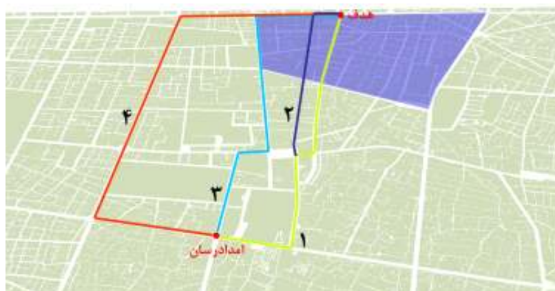
شکل ۱ - چهار مسیر پیشنهادی انتخاب شده توسط کارشناس

اسناد مسیر زیاد است. اما ممکن است قدمت ساختمان‌ها و نحوه ساخت این سازه‌ها به نحوی باشد که کارشناس احتمال تخریب آن‌ها را کم ببیند و آن را به عنوان یکی از مسیرهای پیشنهادی انتخاب نماید. بنابراین، کارشناس می‌تواند با مشاهده این مدل‌ها به شناسایی مسیرهای مناسب بپردازد.