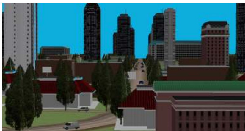
شکل ۲ - مدل سه‌بعدی بخشی از مسیر پیشنهادی شماره یک

چهار مسیر فوق توسط کارشناس از روی مدل سه‌بعدی منطقه انتخاب گردیده است. شکل ۳ بخشی از مدل سه‌بعدی مسیر شماره یک را نشان می‌دهد. همانطور که در شکل مشخص است، ساختمان‌های بلندمرتبه‌ای در کنار جاده‌ای با عرض کم وجود دارد. لیکن چنانچه این ساختمان‌ها تخریب گردند احتمال