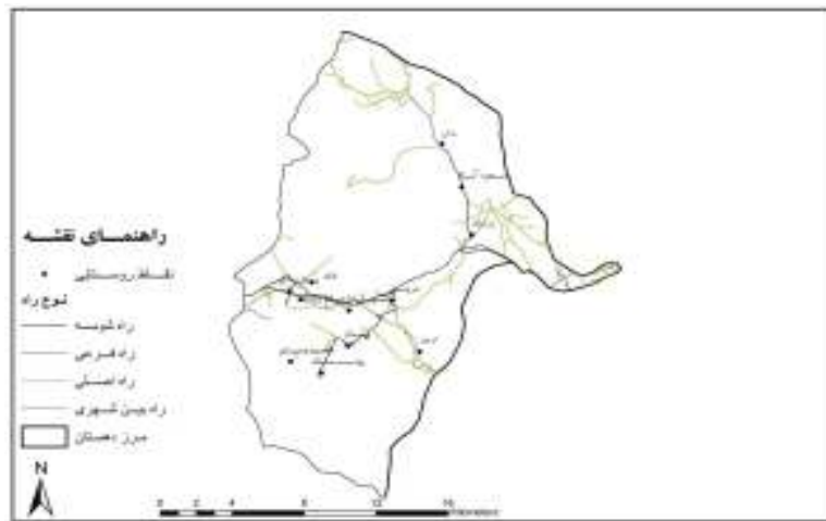
نقشه شماره ۳- موقعیت فضایی روستاها در دهستان سیلاخور شرقی