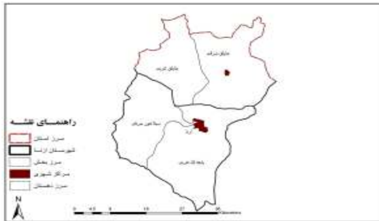
نقشه شماره ۲- موقعیت فضایی دهستان سیلاخور شرقی در شهرستان ازنا