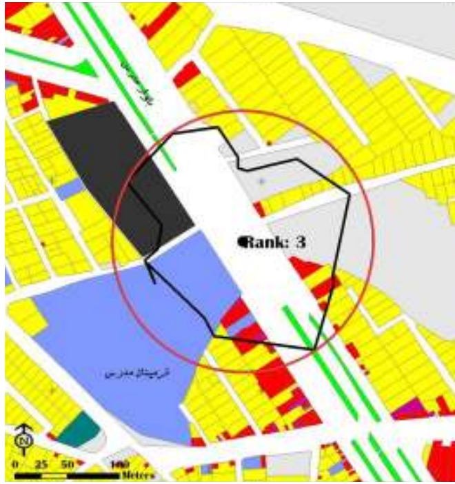
شکل ۲ توزیع کاربری‌ها در محدوده عملکردی پل

است. همچنین برای تحلیل اثرگذاری کاربری‌های همجوار پل بر میزان استفاده برای هر یک از پل‌های