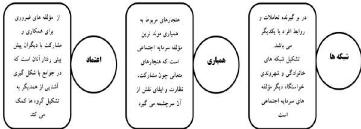
شکل (۲) مفاهیم اساسی تعریف سرمایه اجتماعی از دیدگاه رابرت پوتنام

منبع (Sun & Shung, 2014:336) (خواجه شاهکوهی و همکاران، ۱۳۹۳: ۱۸)