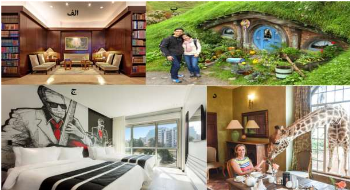
شکل ۱. نمونه‌ای از هتل‌های موضوعی در جهان (شکل ۱ الف: هتل کتابخانه نیویورک آمریکا (منبع: https://www.pinterest.com/pin/ ؛ شکل ۱ ب: هتل هاییت در نیوزلند (منبع: https://libraryhotel.com/en/596938125582774898/ )؛ شکل ۱ ج: هتل موسیقی افاج فینکس در لیسبون پرتغال ( https://www.cybevasion.fr/hotel-hf-fenix-music-lisbonne-h729787_en.html )؛ شکل ۱ د: هتل مانور زرافه در کنیا ( https://www.tripadvisor.com/Hotel_Review-g294207-d302824-Reviews-Giraffe_Manor-(Nairobi.html )).

مشتریان از اقامت در هتل‌های موضوعی به دست آورده‌اند که عبارت‌اند از: منحصر به فرد بودن، تمایل و انسجام، موضوع فرهنگ و کیفیت تجربه، جذابیت موضوع، موقعیت جغرافیایی و موضوع معماری، طراحی و سرویس داخلی و اتمسفر آن، موضوع امکانات و کالاهای اساسی، موضوعات وابسته و کالا، فعالیت‌ها و خدمات.