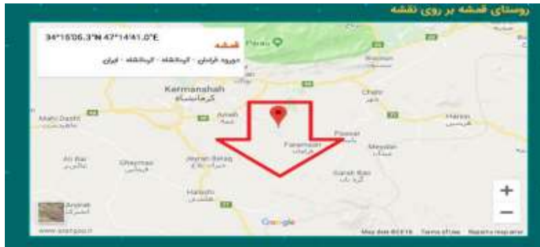
نقشه ۱. موقعیت جغرافیایی ایستگاه پمپاژ آب روستای قمشه - درود فرامان