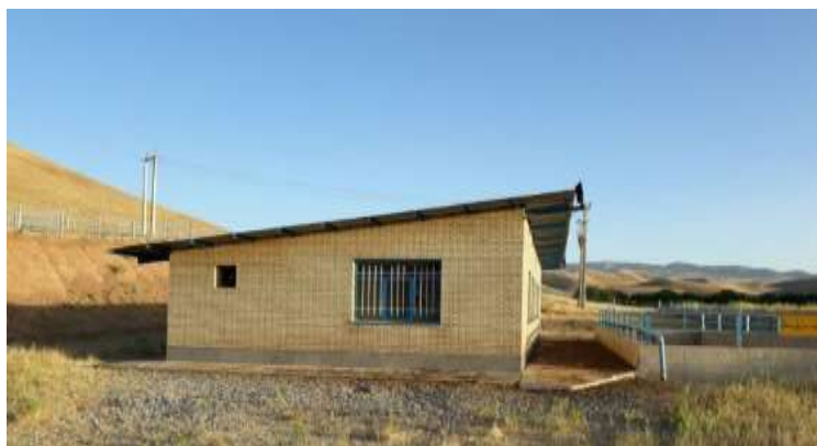
شکل ۱. ایستگاه پمپاژ آب روستای قمشه - درود فرامان