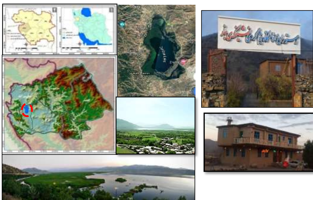
شکل (۲) موقعیت منطقه مورد مطالعه و نمونه اقامتگاه‌های بومگردی محور تالاب زریوار.

با توجه به جذابیت منطقه در راستای جذب سرمایه‌گذار به‌ویژه به‌واسطه هم‌جواری با مرز بین‌المللی باشماق و اقلیم کردستان عراق به‌عنوان یک بازار مهم اقتصادی و گردشگری کشور، این منطقه پرتوان گردشگری با توجه به سیاست‌گذاری انجام گرفته در حوزه گردشگری استان مبتنی بر توسعه بومگردی‌ها به‌صورت قارچ‌گونه شاهد افزایش اقامتگاه‌های بومگردی با وجود دارا بودن ضعف‌ها و چالش‌های اساسی در تمامی عناصر زنجیره فعالیت‌های گردشگری از جذب تا تجربه‌سازی و بازگشت گردشگران است و دید کمی به افزایش تعداد واحدهای بومگردی در این فضای گردشگری منطقه آینده‌روشنی را در ارتباط با اثربخشی این اقامتگاه‌ها ترسیم نمی‌کند.