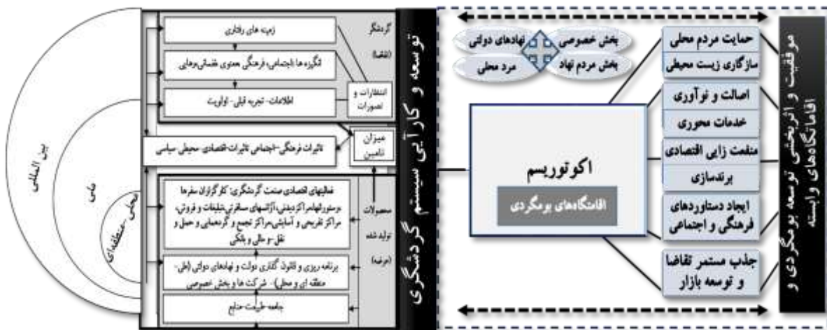
شکل (۱) مدل مفهومی پژوهش مبتنی بر اهمیت و ارتباط متقابل مدیریت سیستمی مقاصد گردشگری و توسعه بومگردی و

اقامتگاه‌های وابسته به آن در مقاصد گردشگری.